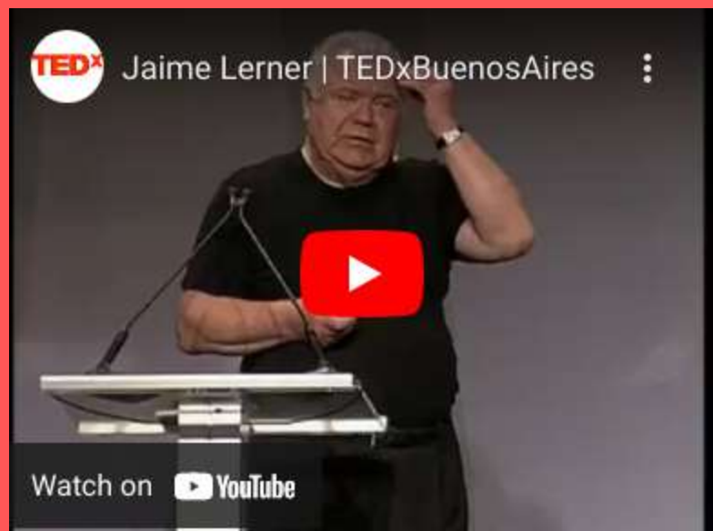
Jaime Lerner. Cómo pensar una ciudad

Se foramos quen de visualizar o espazo coma se estivésemos nun escenario do Universo Marvel, todo parecería indicar unha división de poderes: Capitana Marvel Vs Iron Man, ámbolos dous superheores dispostos a canalizar os seus poderes de cara a un futuro incerto que nesta realidade que nos toca vivir, ben podería chamarse eleccións locais.